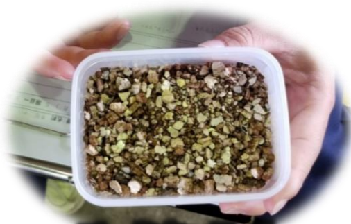
バーミキュライト